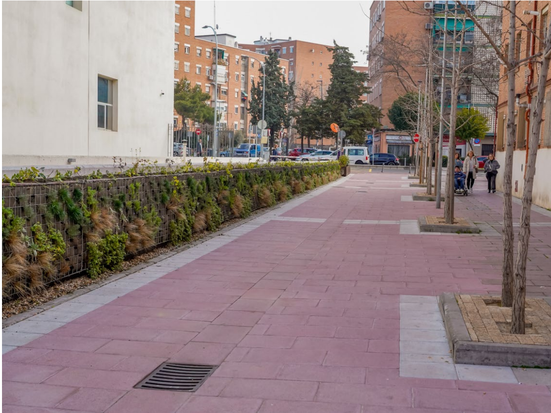
Jardín vertical en travesía Virgen de Loreto, junto al Centro de Control de la Policía Local