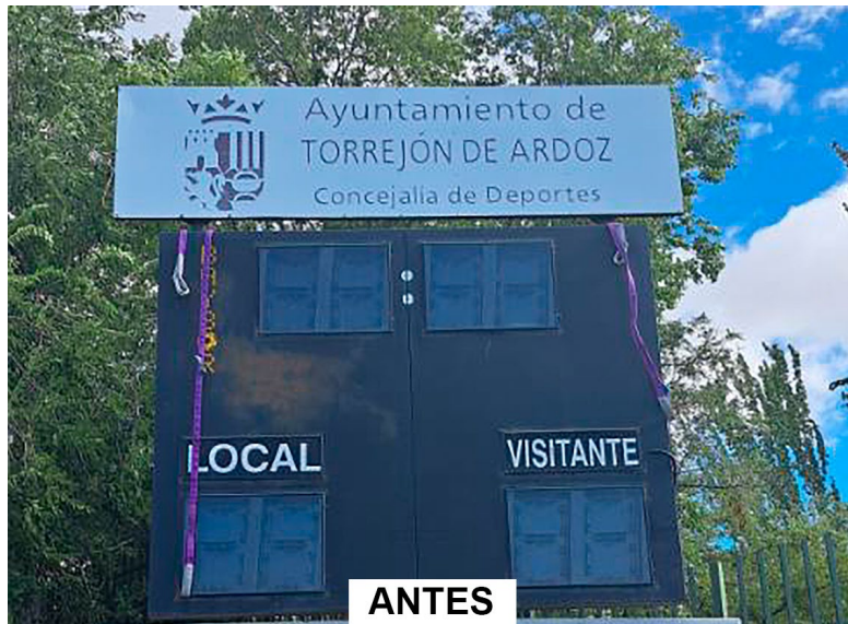
Antiguo marcador Campo de Fútbol Municipal Las Veredillas