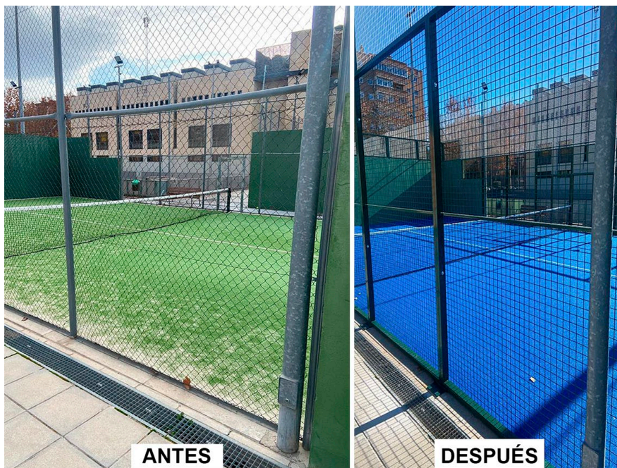
ANTES DESPUÉS Pistas de pádel Complejo Deportivo Londres