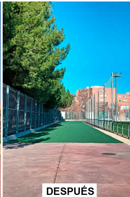
Campos de Fútbol Municipales José María Gutiérrez "Guti"