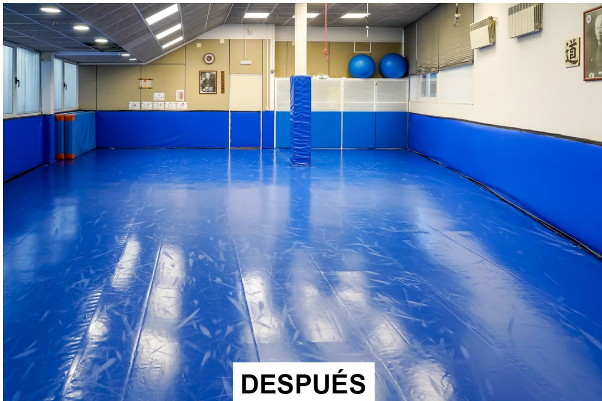
Tatami de la sala de artes marciales