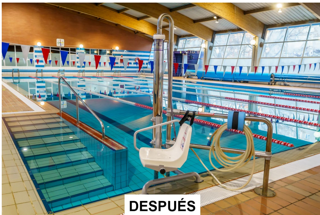
DESPUÉS Nueva silla de acceso a piscina para personas con diversidad funcional.