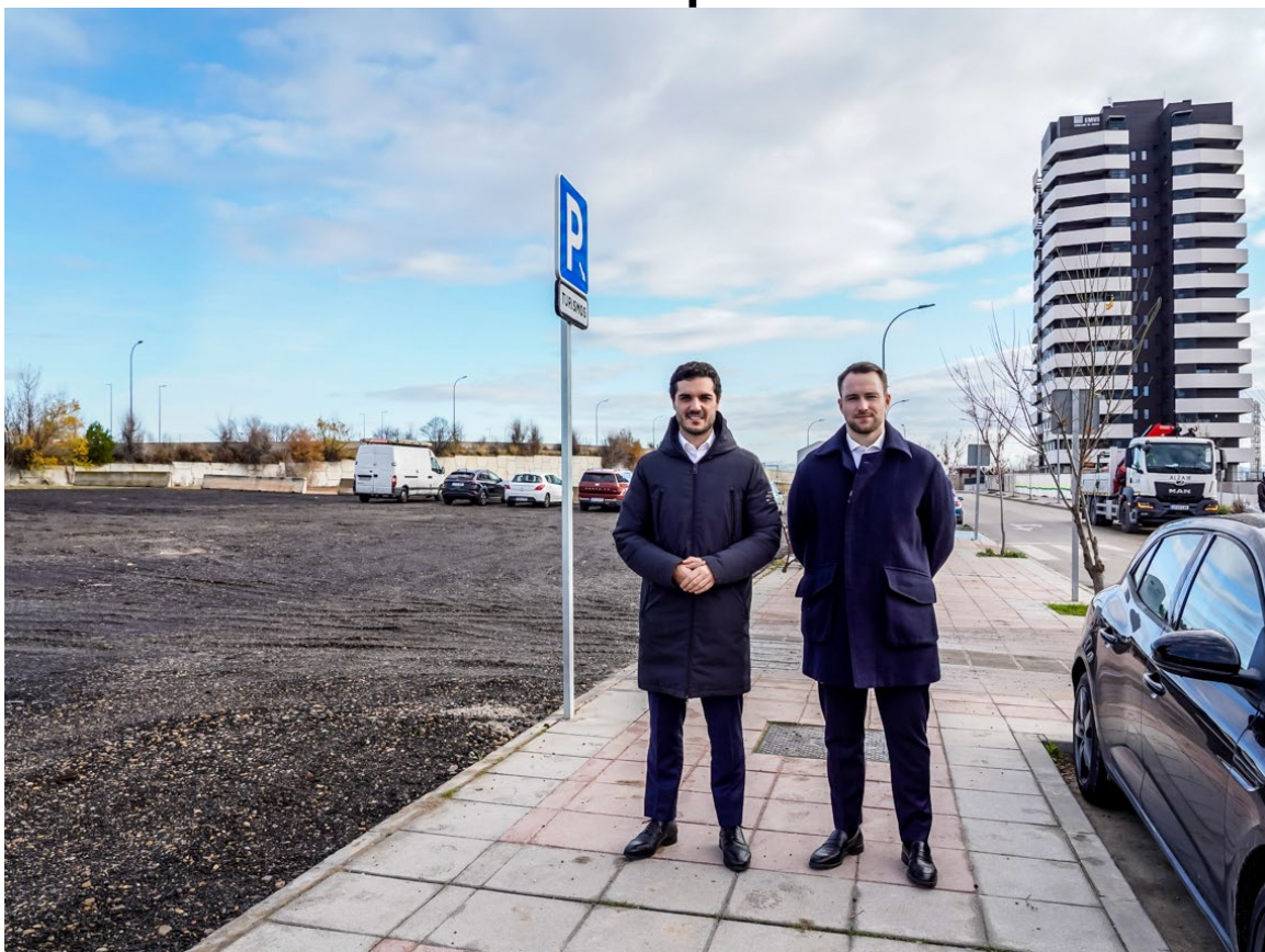
Alejandro Navarro Prieto, alcalde de Torrejón de Ardoz, y Víctor Miranda Lozano, 1er teniente de alcalde y concejal de Urbanismo, Vivienda y Juventud, en el aparcamiento de la calle Malala Yousafzai (Soto Norte)

El Ayuntamiento de Torrejón de Ardoz abre tres nuevos aparcamientos en superficie gratuitos que suman 204 plazas en las calles Orfebrería (Parque Cataluña), Malala Yousafzai (Soto Norte) y en la calle Valle del Honor (Barrio del Castillo) y que se integran en el Plan 16.000 Plazas de Aparcamiento