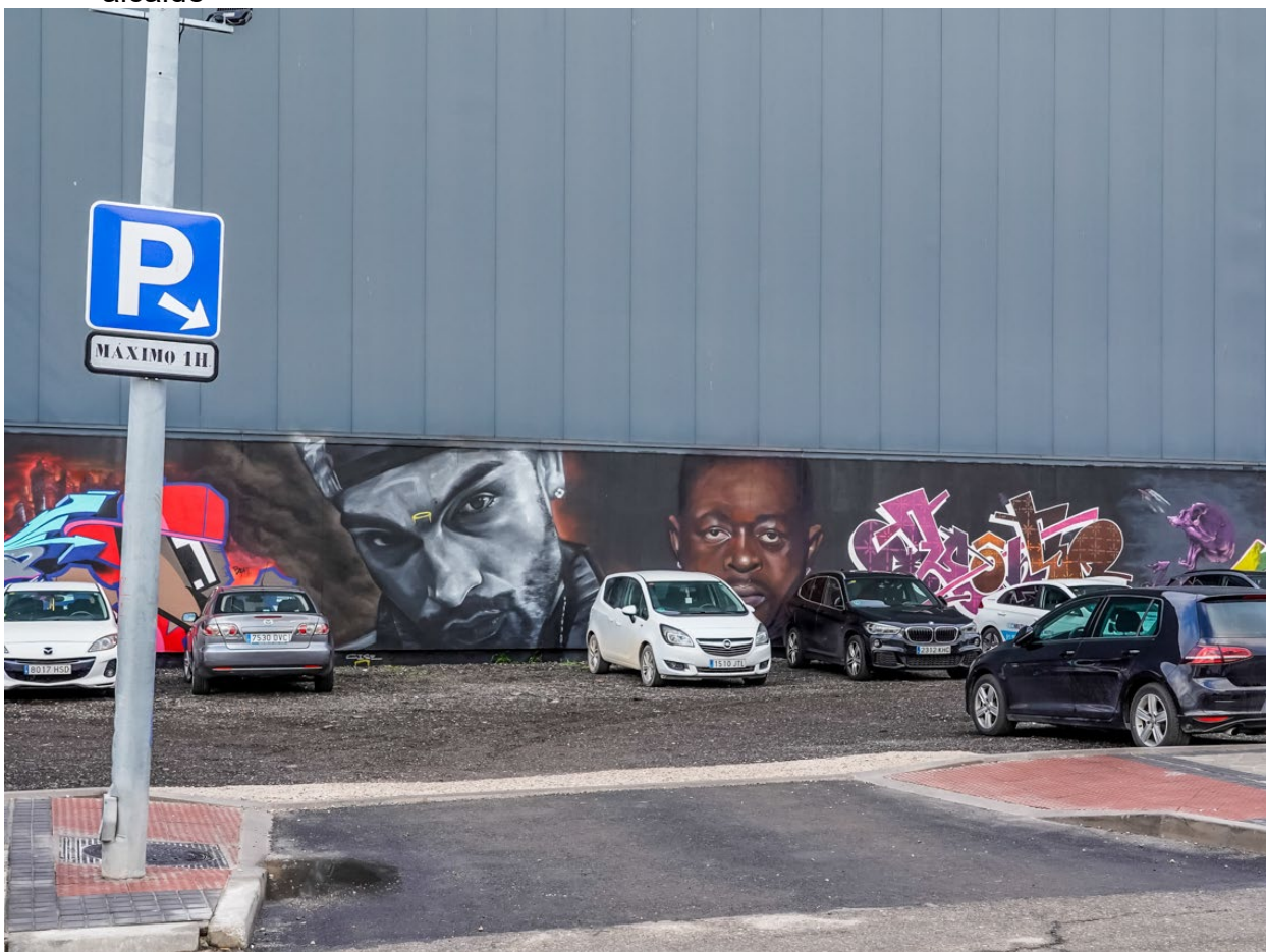
Imagen del estacionamiento de la calle Orfebrería con 20 plazas de aparcamiento